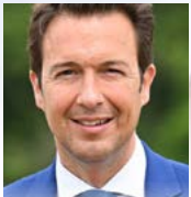
Guillaume PELTIER Ancien n°2 de LR