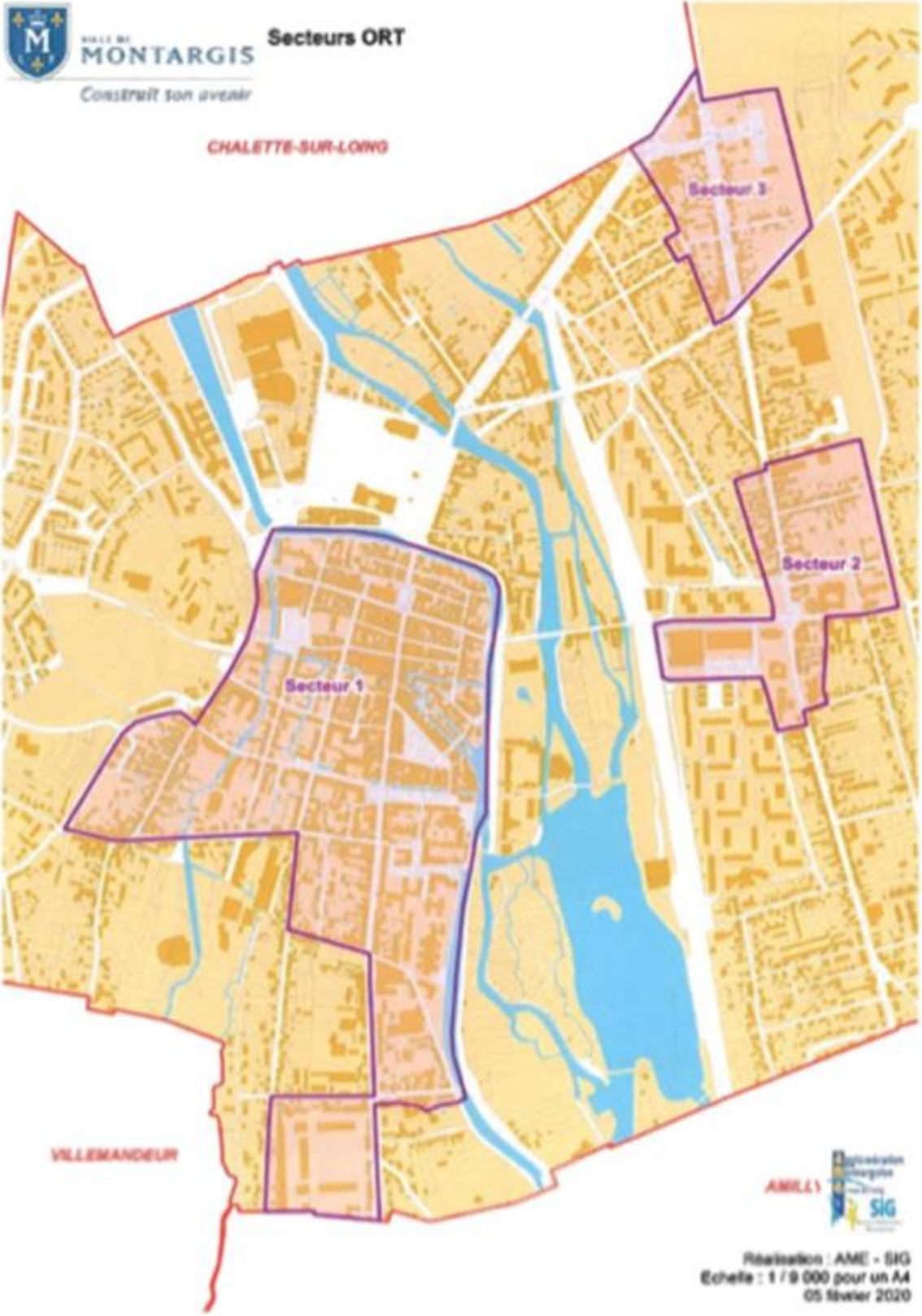
Annexe 3 : Cartographie des périmètres des secteurs d'intervention et liste des adresses incluses dans les secteurs d'intervention