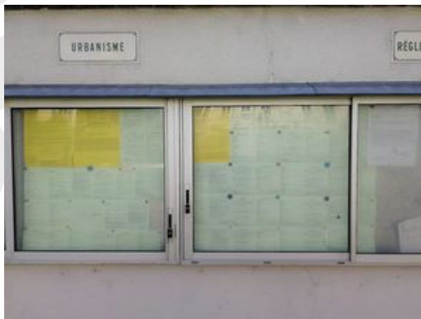
Dimension enquête publique suite