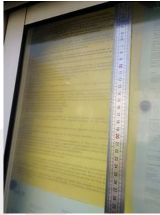
Dimension enquête publique