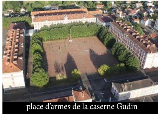
place d'armes de la caserne Gudin