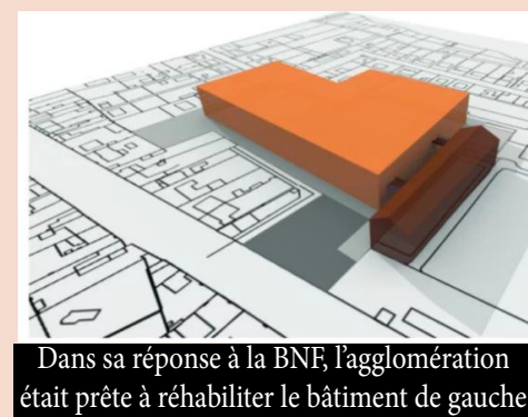
Dans sa réponse à la BNF, l'agglomération était prête à réhabiliter le bâtiment de gauche

Toutes les études recommandent la réhabilitation de ce patrimoine.