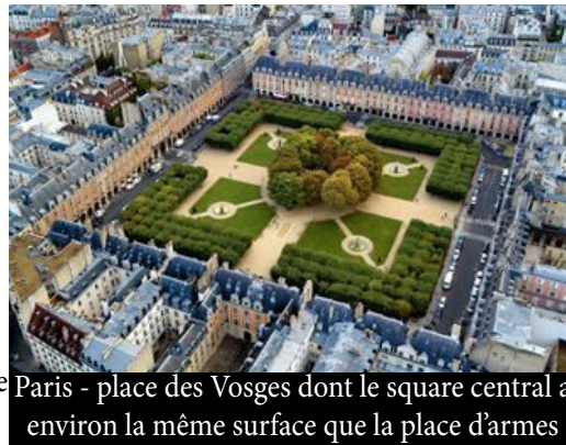
Paris - place des Vosges dont le square central a environ la même surface que la place d'armes