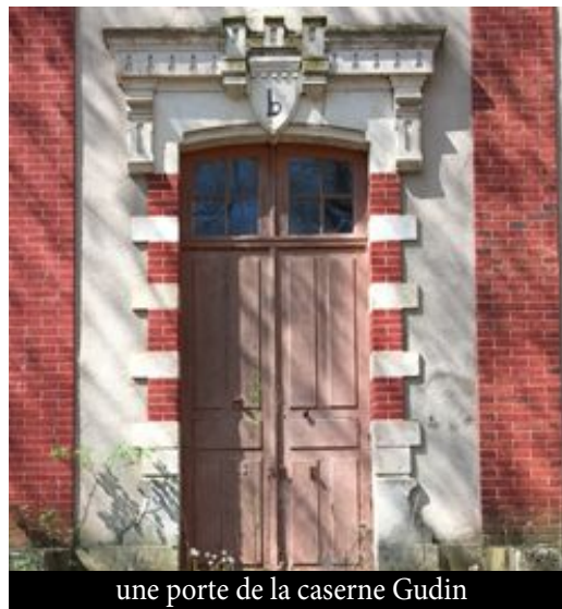
une porte de la caserne Gudin