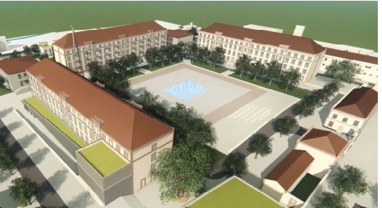
Projet d'un des 3 cabinets d'architectes

L'histoire de l'avenir de la caserne Gudin est non seulement un enjeu majeur pour notre agglomération, mais aussi très révélateur de l'état de la démocratie montargoise. L'association Engagement Citoyen pour le Montargois est l'association qui : - porte les recours de SauvonsGUDIN - a demandé la protection de la caserne Gudin - organise le débat pour l'avenir du site