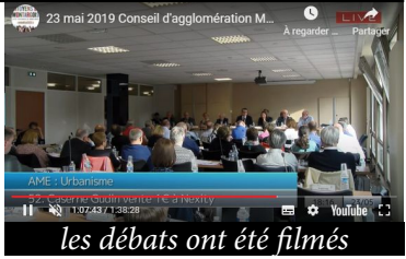
les débats ont été filmés

Avant les élections municipales, l'agglomération a financé une étude de 3 cabinets d'architectes qui avait dans leur cahier des charges 2 points fondamentaux : - conserver les bâtiments de la place d'armes - intégrer, avec l'aide de Nexity, une résidence service sénior dans le bâtiment de l'horloge. Aucun élu n'a affirmé à l'époque que c'était trop coûteux, et ils disposaient à l'époque des mêmes éléments qu'aujourd'hui ! Pourquoi ce revirement ? Pourquoi vouloir aujourd'hui raser ce patrimoine ? Il y a lieu de s'interroger sur les motivations réelles de nos élus actuels sur ce dossier ! Surtout lorsque le président d'agglomération de l'époque, Frank Supplisson a été reconnu coupable de prise illégale d'intérêt sur une autre affaire.