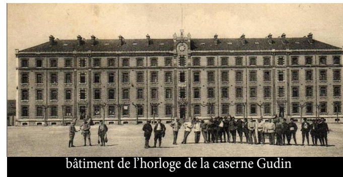
bâtiment de l'horloge de la caserne Gudin